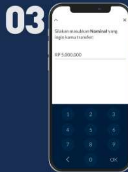
Ketik Nominal yang ingin ditransfer lalu klik ok