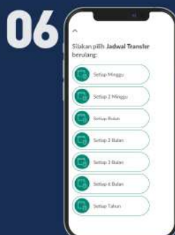
Klik Setiap Bulan