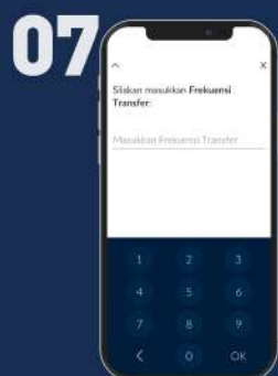
Ketik frekuensi sesuai keinginan*