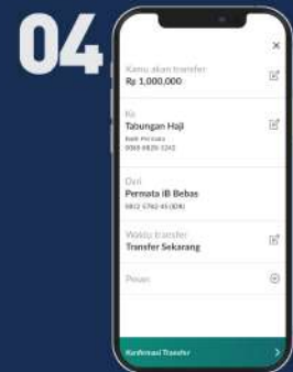
Klik Transfer Sekarang