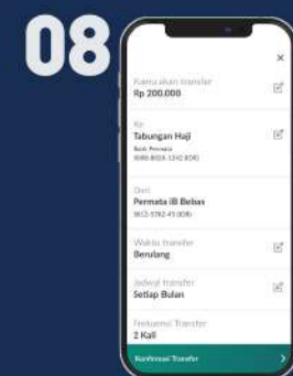
Klik Konfirmasi Transfer

* Waktu 1 tahun = 12 frekuensi; 2 tahun = 24 frekuensi; 3 tahun = 36 frekuensi; dan seterusnya.